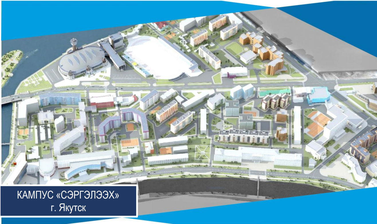
КАМПУС «СЭРГЭЛЭЭХ» г. Якутск